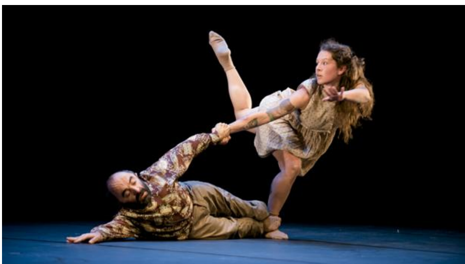
Espectáculo de Colectivo el Brote