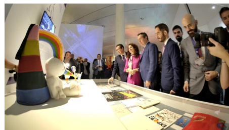
La muestra en recuerdo de la Expo 92 en el Pabellón de la Navegación - J. M. SERRANO