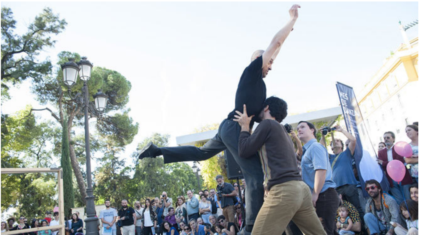
Una imagen de 'En vano', de Cía Danza Mobile e Incubo Teatro.